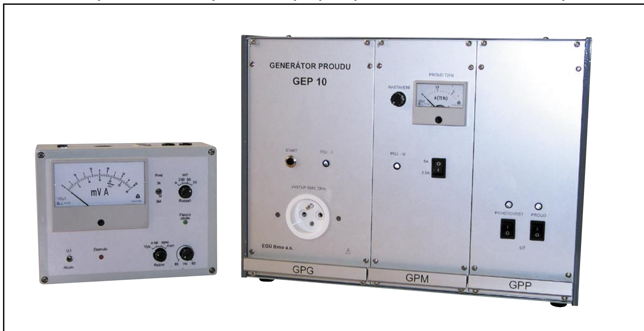
Obr. 2: Měřicí souprava EGÚ Brno, a.s. pro měření dotykových napětí – Selektivní voltmetr a Generátor proudu GEP 10

významnou částí je soubor ochrany proti nestandardním stavům, zejména: - nezatíženému výstupu měniče DC/DC, - při zkratu výstupních svorek, - při vnuceném indukovaném proudu do výstupu měniče DC/DC, - při zvýšeném napětí na výstupních svorkách vlivem indukovaného proudu při souběhu vedení vvn.